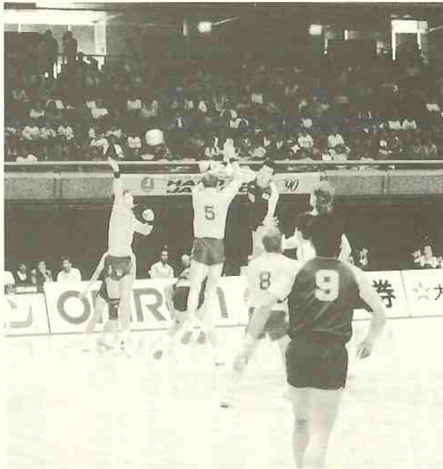
世界の王者・スウェーデンを相手に大善戦

その一端でも覗けばと非常に興味を持って国際大会である。さて試合は、ジャパンカップ、ファイナル。観客も最終戦とあってスタンドはほぼ満員。美しい体育館で雰囲気も満足。