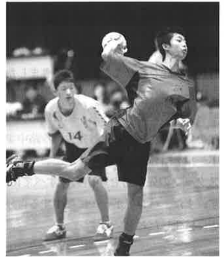
6点すべて