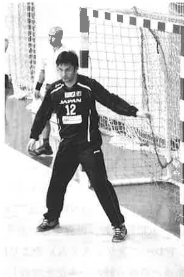
「第14回男子アジア選手権」